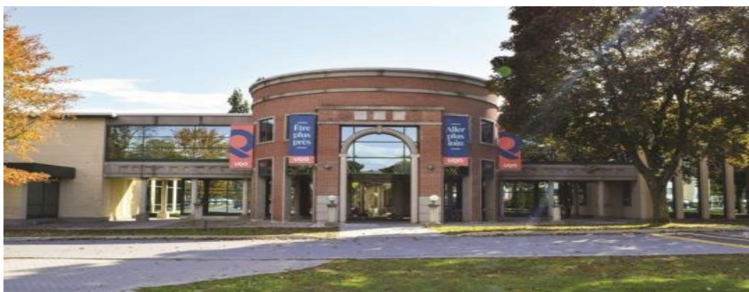
Campus de Gatineau.

Le Département des sciences comptables de l'Université du Québec en Outaouais cherche actuellement à pourvoir deux (2) postes de professeur.es dans le secteur de la comptabilité financière à son campus de Gatineau.