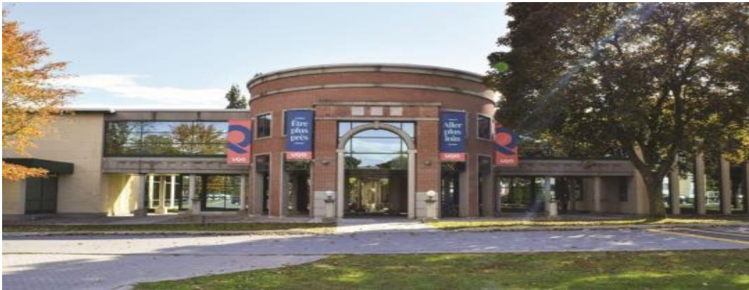
Campus de Gatineau.

Le Département des sciences comptables de l'Université du Québec en Outaouais cherche actuellement à pourvoir un poste de professeur.e dans le domaine de la certification à son campus de Gatineau.