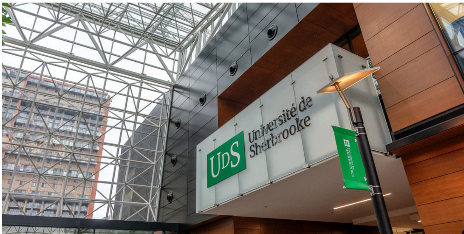
Campus de Longueuil