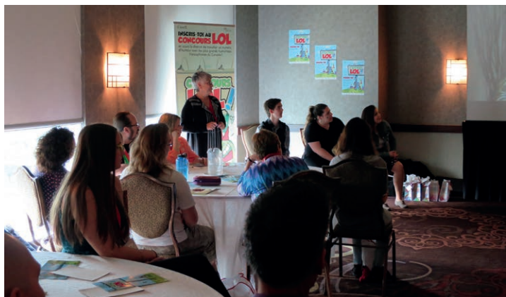
Année après année, plus de 95% des congressistes se disent satisfaits de leur participation à l'événement