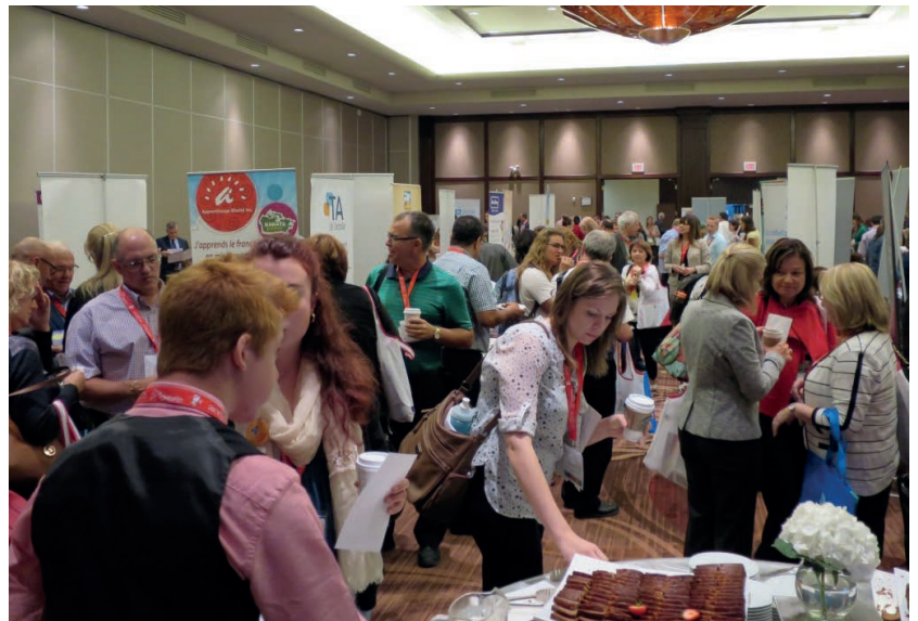
Plus d'une cinquantaine d'organismes seront au salon pour présenter leurs ressources et services.

Devenez membre de l'ACELF et économisez sur l'inscription!