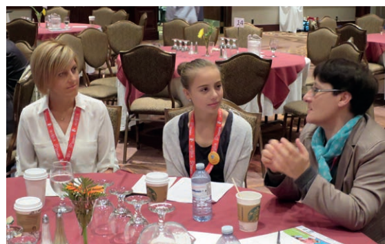
Les congressistes échantent des idées durant le congrès

Laissons les jeunes expliquer, dans leurs propres mots, ce que représente la citoyenneté numérique dans leur réalité. Ils guideront ensuite les discussions en petit groupe pour qu'ensemble nous trouvions des façons de prendre notre place dans le cyberspace.