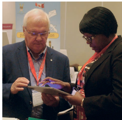
Lors de l'événement, suivez le mot-clic #franconumérique2016