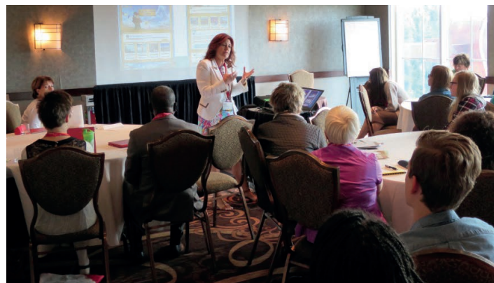
Les ateliers sont offerts par des animateurs chevronnés provenant de partout au Canada